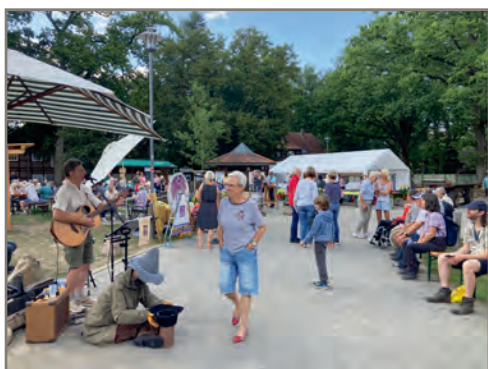
Musik gab's auch