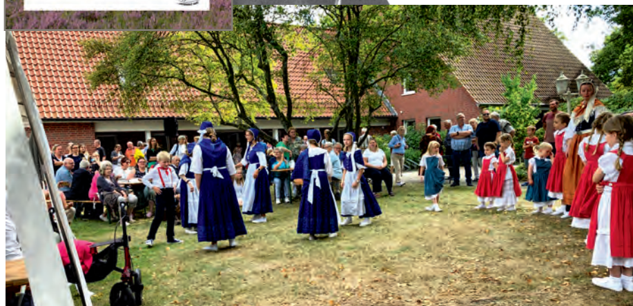
Heidesonntag mit Kindervolkstanzgruppe aus Ramelsloh