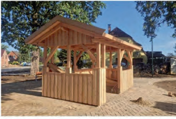
Dorfentwicklung Evendorf Wiedsal/ Schwindeweg