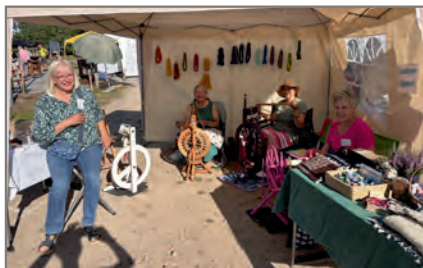
Heimatverein und Spinnkreis