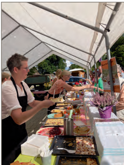
Kuchenbuffet der Döhler Dorfgemeinschaft