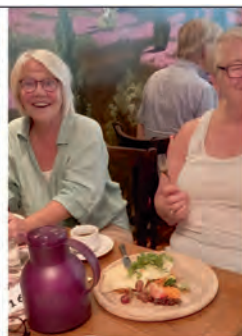
Petras Käsebröte ist auch nicht zu verachten!

Auch im Internet: www.buchhandlung-hanstedt.de - BUY LOCAL - BUY IN HANSTEDT