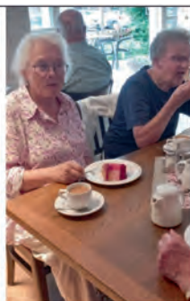
Geiht nix över een scheun Stück Toart!