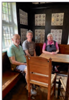
Auch ein Pläuschchen muss sein!