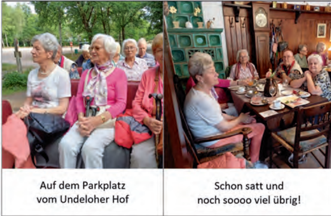
Auf dem Parkplatz vom Undelohrer Hof

Am Sonntag, 20.07.2025, folgten 30 Teilnehmer der Einladung des Heimatvereins und unternahmen bei Sonnenschein und bester Laune einen Ausflug nach Wilsede. Für 18 fröhliche Menschen ging es per Kutsche dorthin, 4 radelten direkt zum Gasthaus „Zum Heidemuseum“, und 8 Wandersleute machten sich zu Fuß auf den Weg.