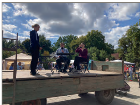
Sketch vom Theaterverein Evendorf