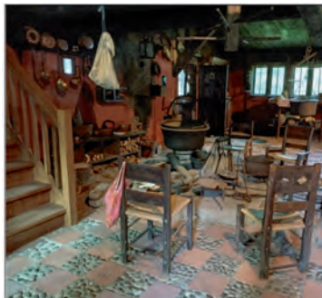
Dat „Ole Hus“

Die Wanderer machten sich teils schon früher auf den Weg und fanden sich pünktlich zum Kaffeetrinken im Undeloher Hof ein. Die Tische im Saal waren liebevoll eingedeckt. Buchweizen- und Himbeertorte sowie Käsebröte warteten schon auf uns.