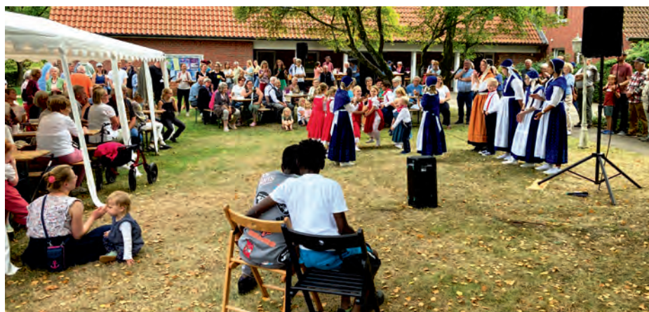
Heidesonntag mit Kindervolkstanzgruppe aus Ramelsloh