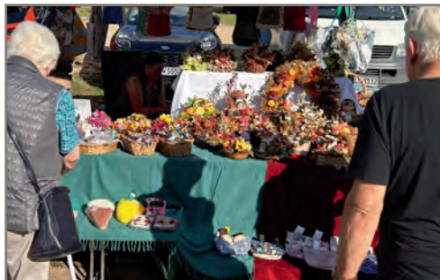
Schönes zum Stöbern