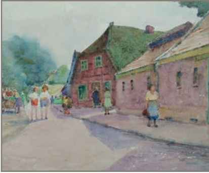
Lübb. Straße Kohrs + Tödter