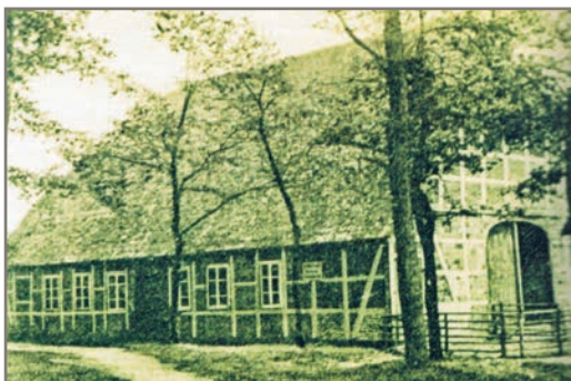
Hökers in Döhle