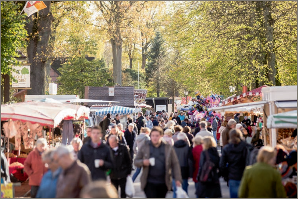
Herbstmarkt in Egestorf