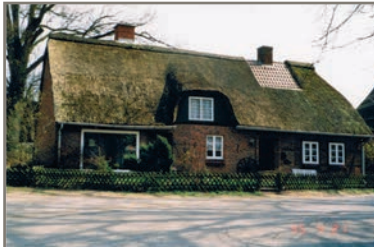
Laden Maybaum - Sahrendorf