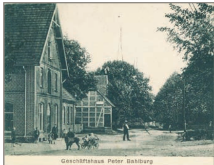
Kaufhaus P.C Bahlburg Egestorf