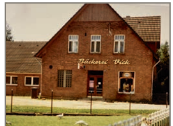
Bäckerei Vick- Evendorf