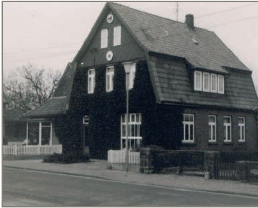
Schuhmacherei H. Ehlers - Egestorf