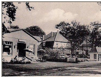
links Bäckerei Wohlgemuth