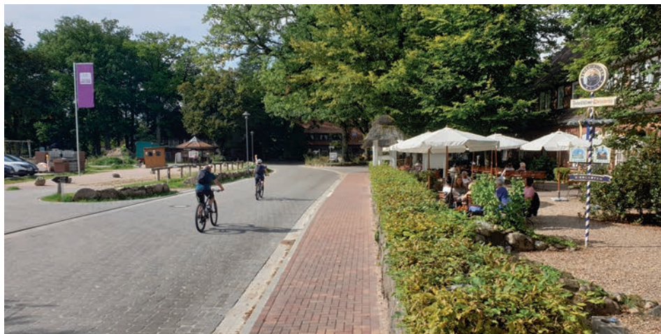
Die Parkplatz Neugestaltung und instandgesetzte Straße vor dem Heide-Landhaus Döhle