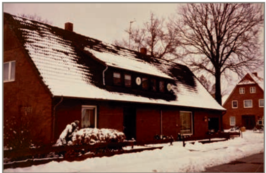
Laden Schneiders - Evendorf