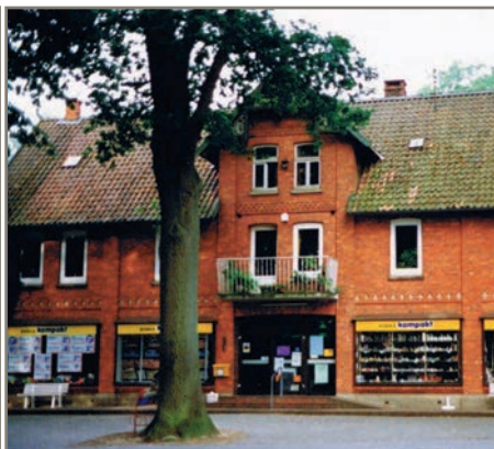
"Edeka kompakt" Leopold Müller 1992