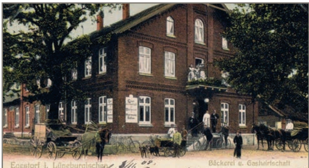
Bäckerei Soltau 1910 mit 2 Bäckerwagen