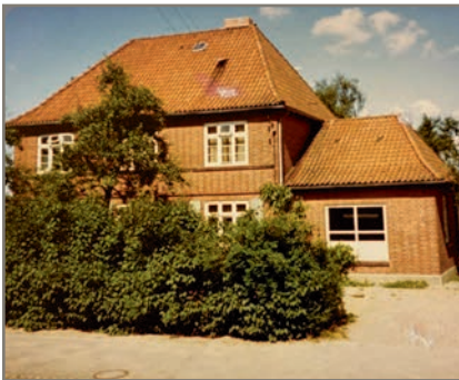
Schuhmacher Meyer - Evendorf