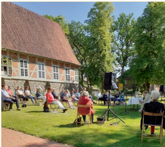
Außengottesdienst vor St. Stephanus