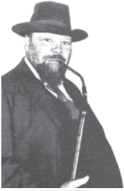
Geselligkeit nach getaner Arbeit