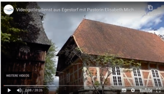
St. Stephanus Video-Gottesdienst im Internet