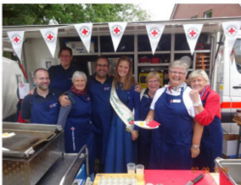
Spiegelei auf Kartoffelbrot mit Schinken, Gurke und Petersilie garniert und Prinzessin

Am diesjährigen Kartoffelfest nahm auch unser Ortsverein mit einem Stand teil: