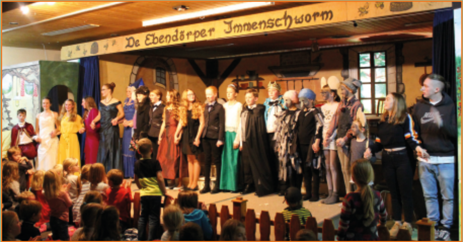
Hier zu sehen im Märchen 2018 „Aschenputtel“

unsere Theaterjugend feiert ihr 25-jähriges Bühnenjubiläum und zeigt Märchenspiel „Schneewittchen und die sieben Zwerge“